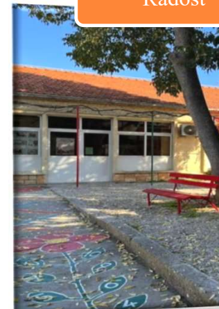
3. Dječji Vrtić Radost