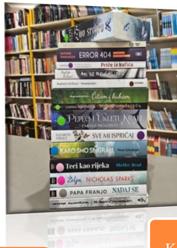
2. Narodna Knjižnica "Šime Vučetić"