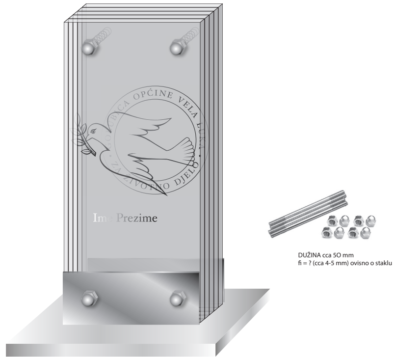
Prilog 1 - izgled statue