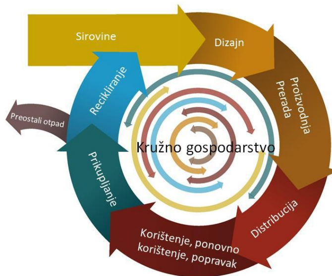
Slika 3. Model kružnog gospodarstva

Nacrt Plana gospodarenja otpadom Općine Vela Luka za razdoblje 2018.-2023. godine